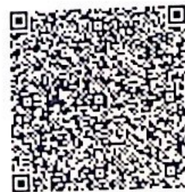
QR định vị VPBD