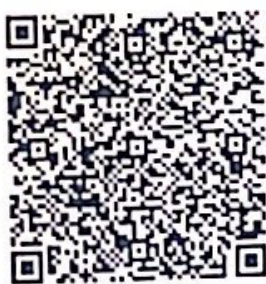
QR định vị VPSG