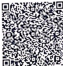
QR định vị VPCT